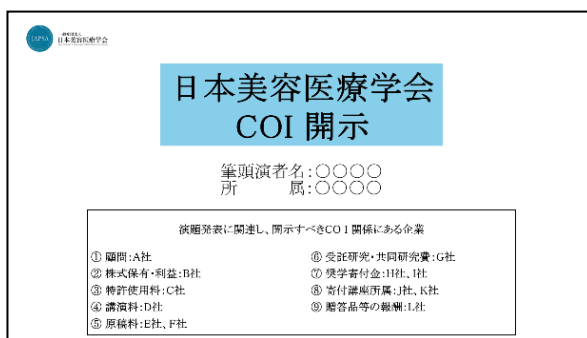
利益相反ありの場合

利益相反(COI)自己申告に関するスライド： https://japsa.or.jp/pdf/COI.zip